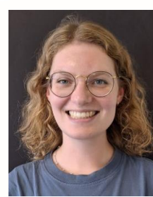
Fanny Derom Arts Ondersteuning arts